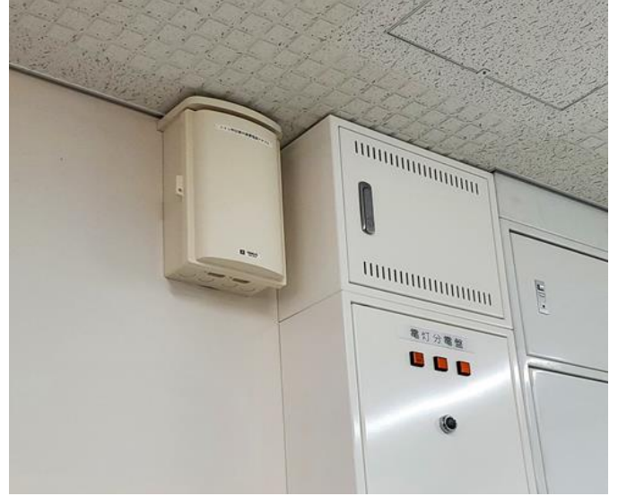
トイレ呼出表示装置電源アダプタ