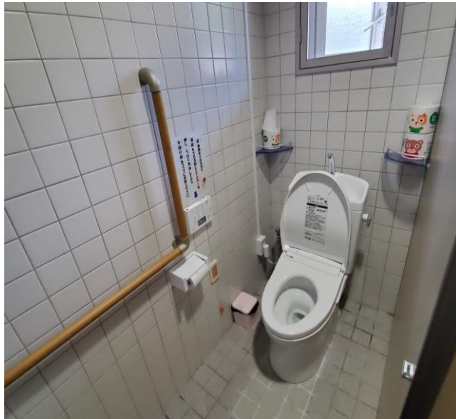
女子トイレ便器取替