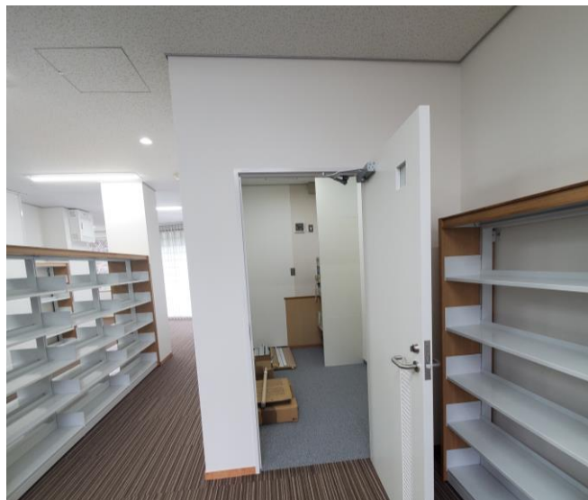
図書ルーム内機械室