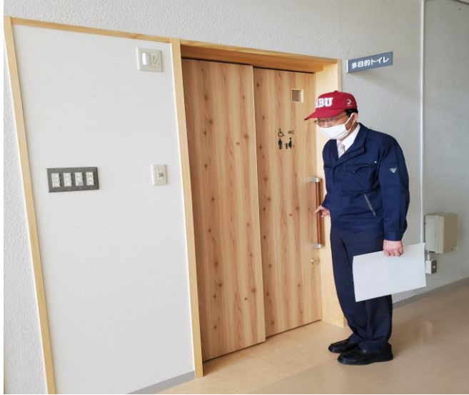
多目的トイレ入り口