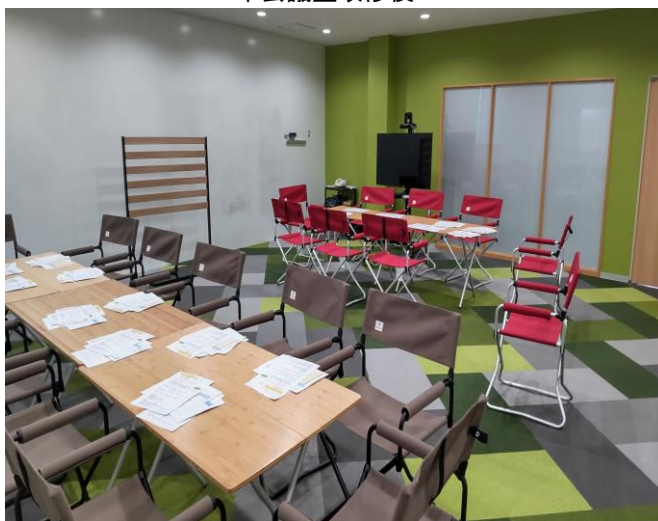
オンライン会議用備品(モニター等)