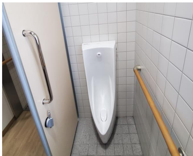
男子トイレ小便器取替