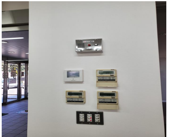
トイレ呼出通話器