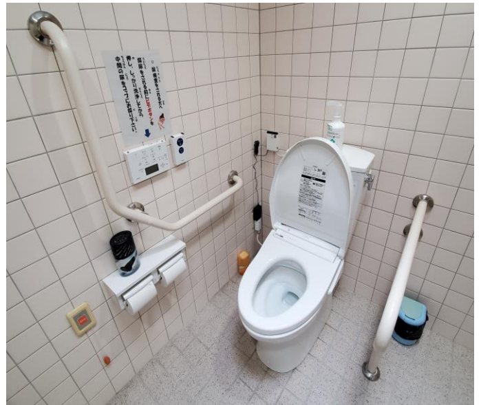
多目的トイレ便器便座取替