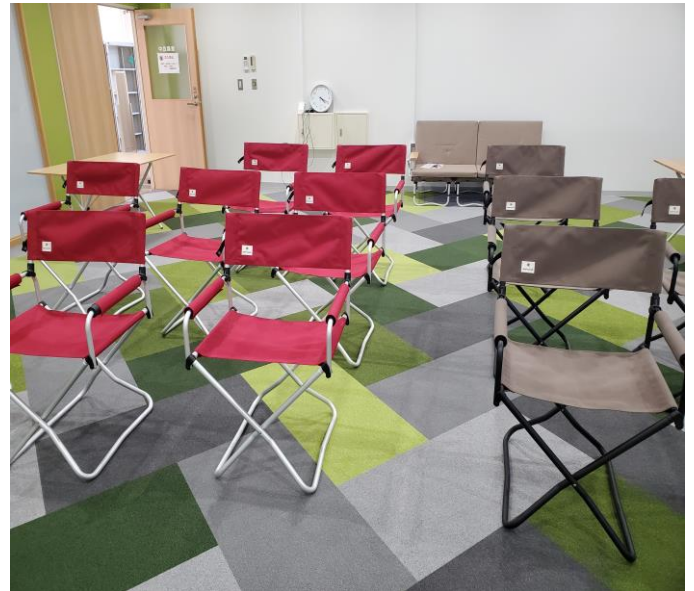
オンライン会議用備品