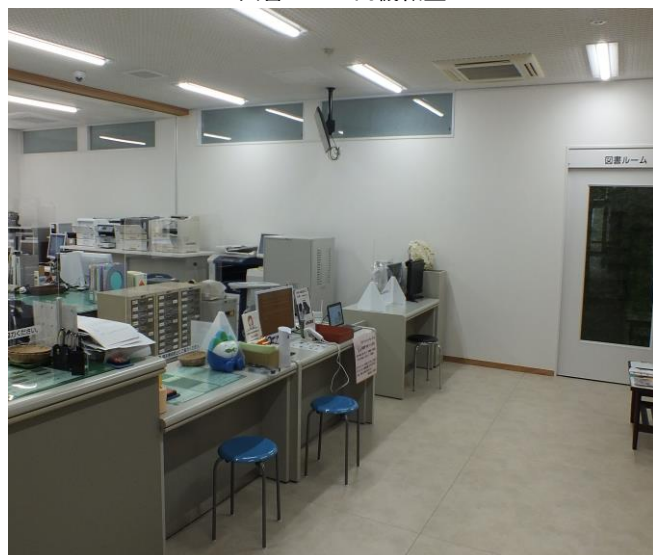
図書ルーム入り口

※新型コロナウイルス感染症対応地方創生臨時交付金 改修工事 28,413,034円 (工期 R3. 4. 14～R3. 11. 26) 阿武建設(株) 他 設計監理業務委託 660,000円 (工期 R3. 4. 10～R3. 12. 10) 株金子信建築事務所