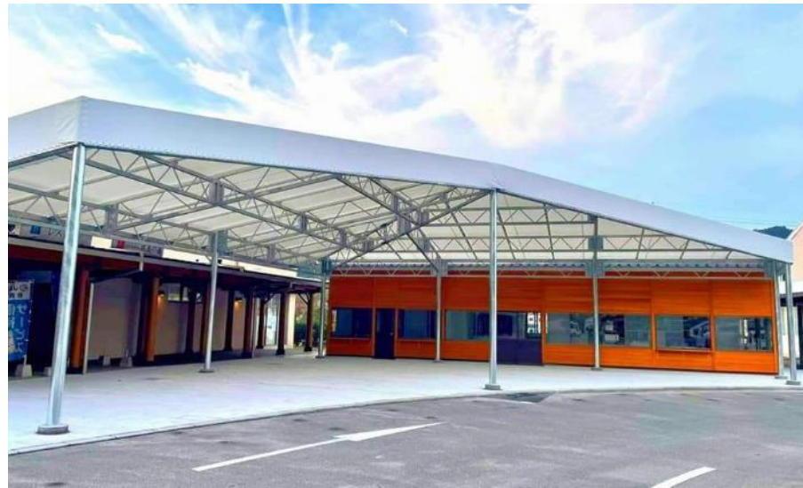
<道の駅テナント棟新設工事> <道の駅交流スペース新設工事>