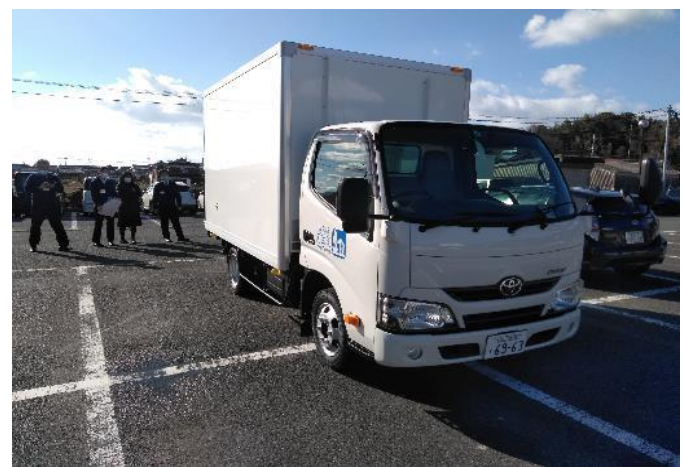
<道の駅集配車(冷蔵車)>