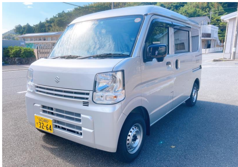
エブリイ(運搬車両)