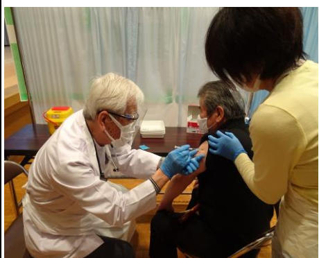
<集団接種 ワクチン接種>