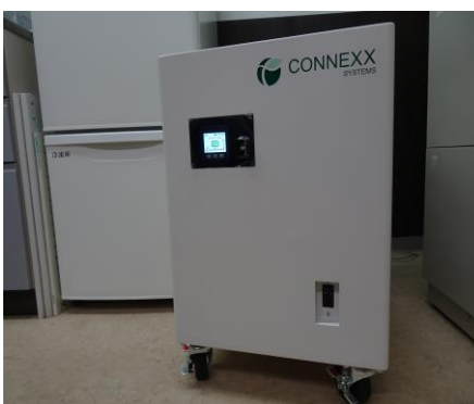
<ワクチン保冷库バックアップ電源>