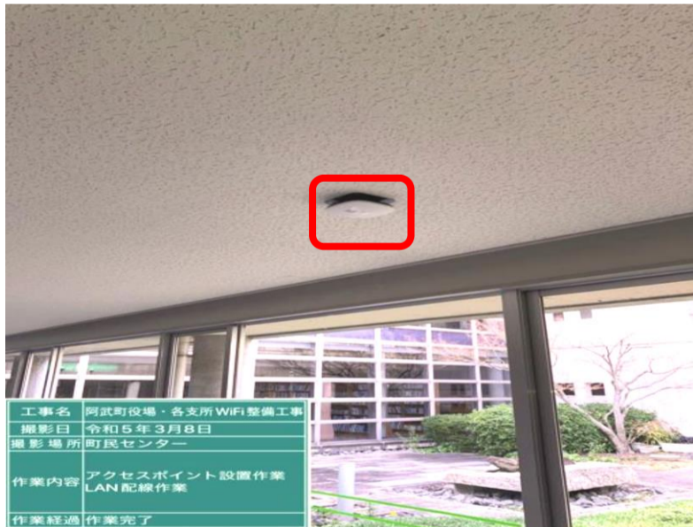
アクセスポイント設置(町民センター)