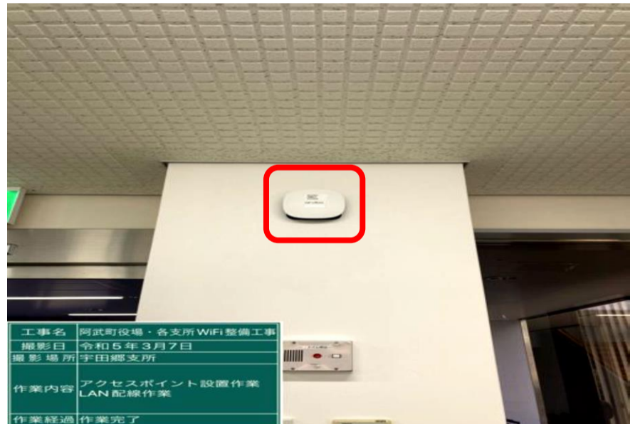
アクセスポイント設置(宇田郷支所)

※新型コロナウイルス感染症対応地方創生臨時交付金 光ファイバ引き込み工事及び無線AP設置工事 6,636,300円 (工期 R5. 1. 20~R5. 3. 31)