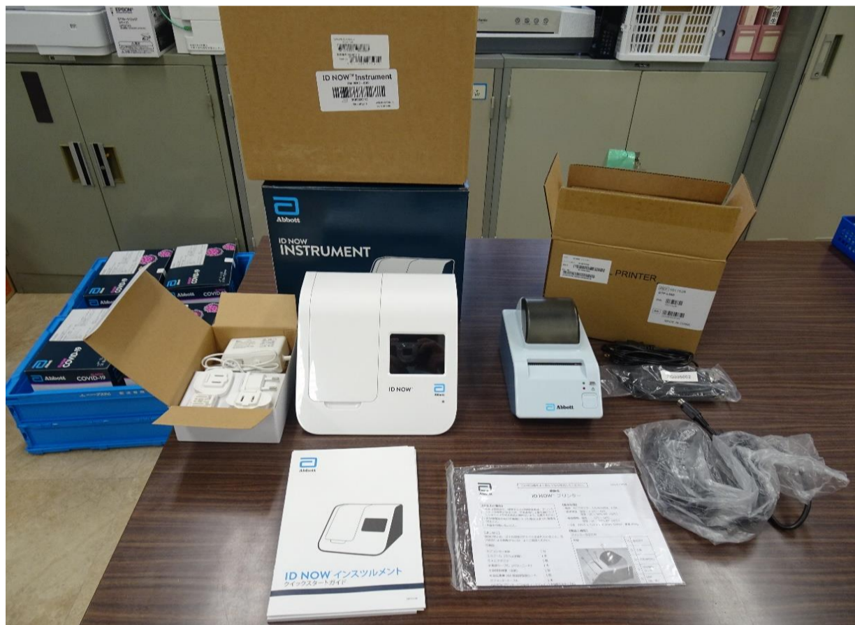
新型コロナウイルスPCR検査機器一式