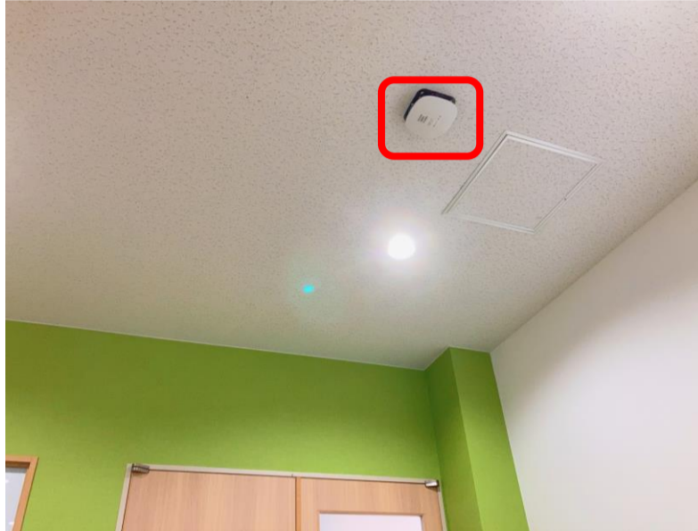
アクセスポイント設置(役場本庁2階中会議室)