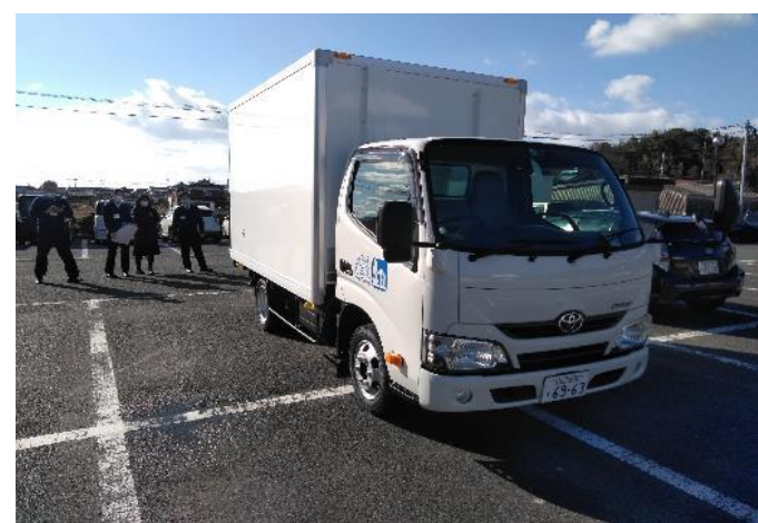
<道の駅集配車(冷蔵車)>